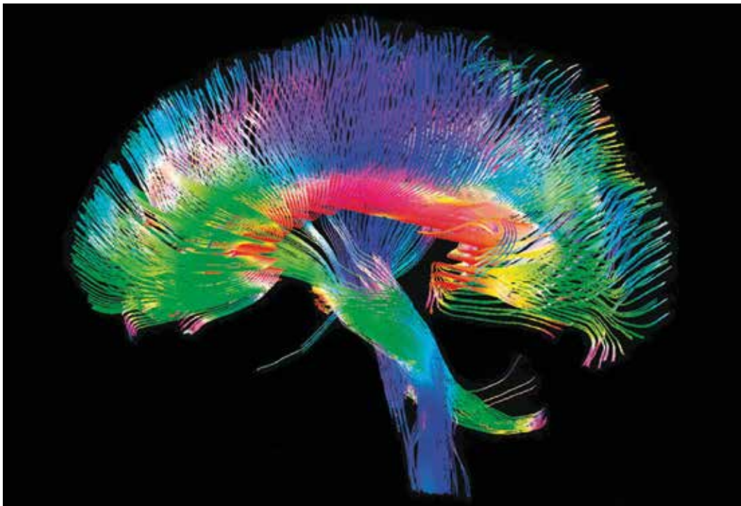
Foto: fMRI ingekleurd, impact of Brainteasers